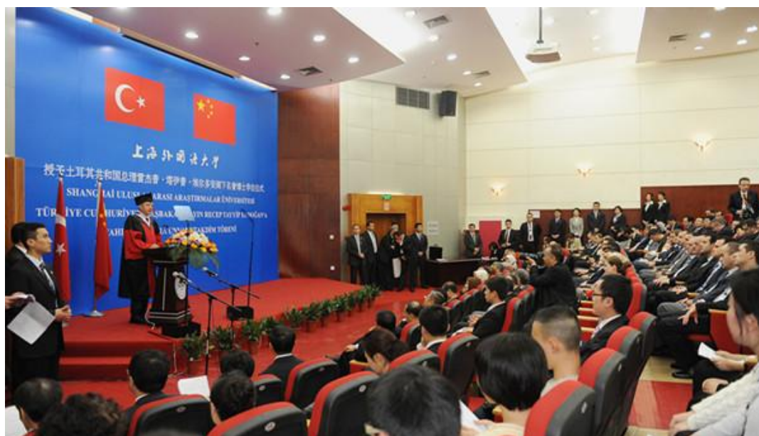
（2012年4月，土耳其总理埃尔多安访问上海外国语大学并发表演说）